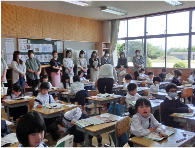
《1年生 授業参観の様子》おうちの人たちの視線が少し気になりましたが、しっかり授業に取り組む姿を披露しました。

4月21日(金)はお忙しい中、3年ぶりとなる参集での授業参観・学級懇談会並びにPTA総会にご出席をいただきありがとうございました。