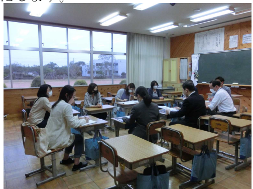
《PTA 広報委員会》新委員長さんを中心に今年度の事業計画を練っています。