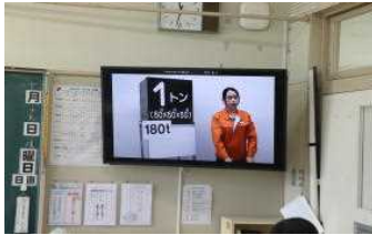
【5年生 鉄のできるまで】

コロナ禍の中「オンライン授業」が進められてきました。最初とまどっていた子どもたちもすっかりタブレット端末に慣れ、当たり前のように授業で使っています。あらためて、子どもの学習における吸収力は素晴らしいと感じています。現在、校外学習もオンラインで行うものがあります。10月は、5年生が日本製鉄鹿島製鉄所とオンラインで「鉄のできるまで」、4年生が水道の出前授業で霞ヶ浦浄水所と「安全な水ができるまで」の授業を行いました。校外学習での授業スタイルも変わりつつあります。