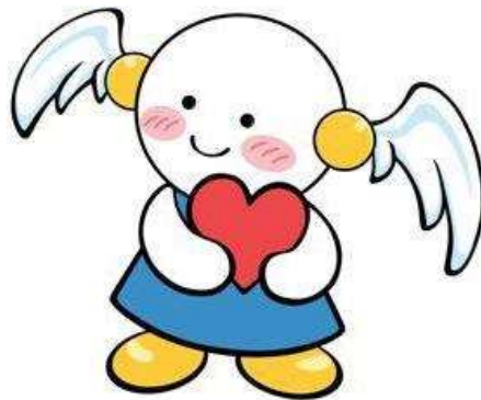
茨城県人権啓発キャラクター 「ココロちゃん」