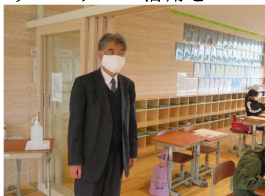
【スクールカウンセラーの先生：授業参観】

過日、ご案内しましたようにスクールカウンセラーとの面談を実施します。特に今年度の相談内容につきましては、今までの子育てや子供への接し方、子供の学校生活・友人関係の悩みばかりではなく、新型コロナウイルスに起因する悩みや不安を抱えている保護者・子供の相談にも積極的に応じます。