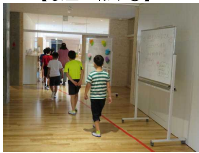
【時間を決めてトイレへ】