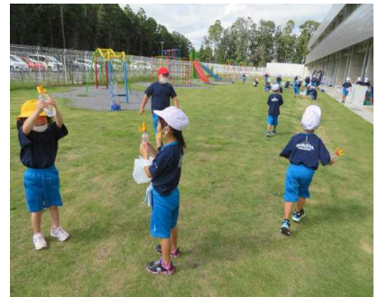
【1年生：生活科の時間】