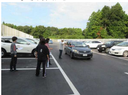
【引き渡し訓練の様子①】

今回は、震度5強を想定しての引き渡しのシュミレーションを行いました。全職員がそれぞれ引き渡し役、呼び出し役、交通整理役、子供役、保護者役などになり実施しました。反省点を生かして万が一に備えたいと思えます。