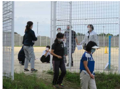
【引き渡し訓練の様子③】