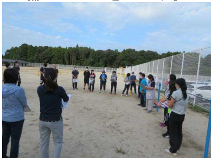
【引き渡し訓練の様子②】