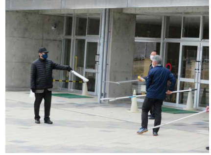
【不審者対応避難訓練】