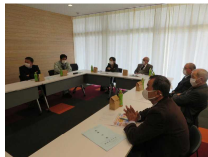
【評議委員会の様子】

その後、オンラインで実施した『6年生を送る会』を参観していただきました。委員さん方からは、一生懸命に取り組んでいる子供たちの様子についてお褒めの言葉をいただきました。