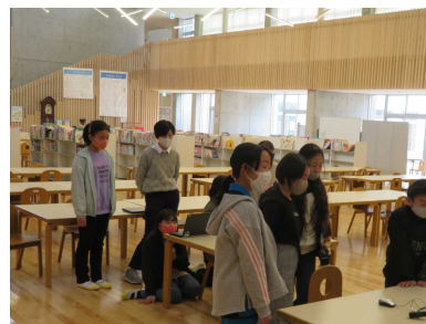
【実行委員の皆さん】

在校生が今まで色々とお世話になった6年生に感謝の気持ちをあらわすことができました。6年生にとって思い出に残る6年生を送る会になりました。中心となった5年生ご苦労様でした。