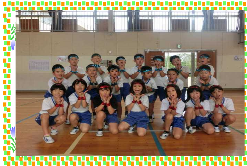
「パズリカダンスではいポーズ!!」

☆10月24日(水)にはまなす公園に於いて1・2年生校外学習を行います。当日はお弁当持参となります。詳しくは、後日配布する文書をご覧ください。