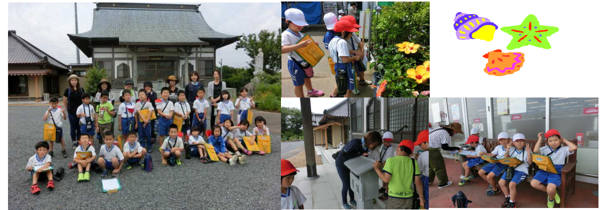
○6月22日、町探検の様子です。

☆学期末といういことで少しずつ荷物を持ち帰りたくと思ひます。7月9日(月)から7月13日(金)の間に持たせますので手さげなどの用意をお願ひします。絵の具セットやお道具箱は点検して、少ない物の補充をしておいてください。