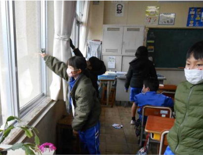
火災なので窓を開めて避難します。