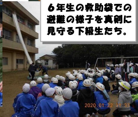
6年生の救助袋での避難の様子を真剣に見守る下級生たち。