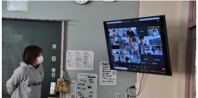
6年生のオンライン学習の様子です。一人一人の学習の様子を確認しながら、授業が進められています。先生からの質問や児童の発表もオンラインで参加者全員に伝達されています。

今後の学校での対応状況については、逐次連絡いたしますので、今後も保護者の皆様や地域の皆様のご協力をお願いいたします。