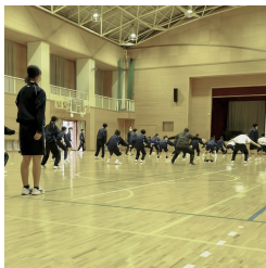
大洋中の伝統「ソーラン節」