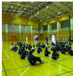
体育祭の練習初日