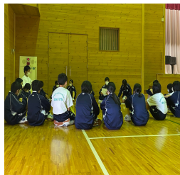
種目のメンバー決め